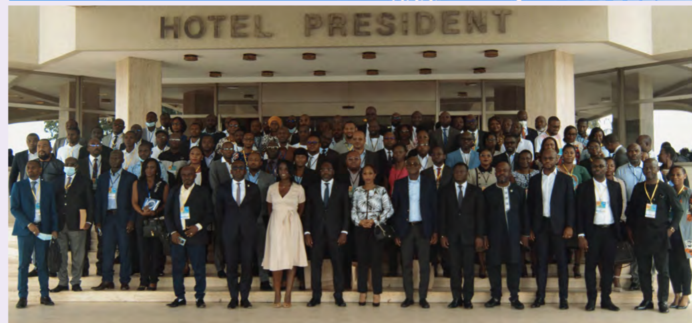
PHOTO DE FAMILLE JNLA 2021