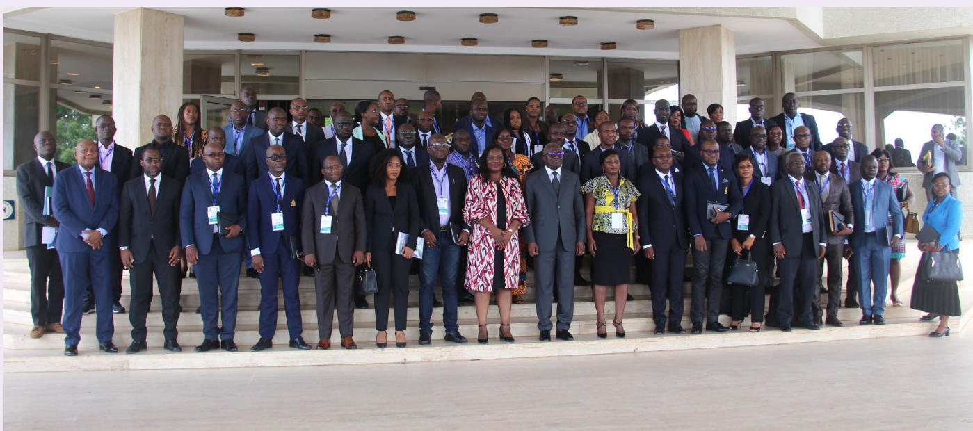
Photo de famille JNMQ 2019