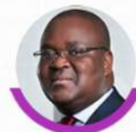
Edoh Kossi AMENOUNVE DG BRVM