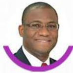
Sidi Tiémoko TOURE Ministre