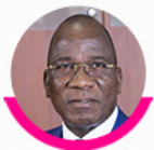
Jacques ASSAHORE Ministre