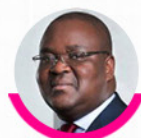
Edoh Kossi AMENOUNVE DG BRVM