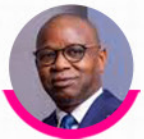
Me Adama KAMARA Ministre