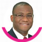
Sidi Tiémoko TOURE Ministre