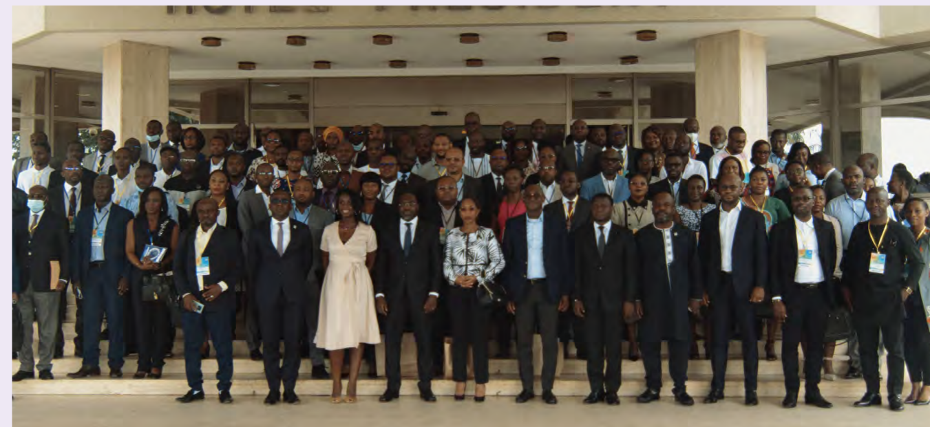
PHOTO DE FAMILLE JNFC 2021