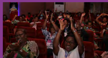
Quand la satisfaction des participantes s'exprime...