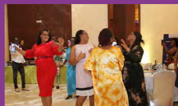
Le show était chaud !