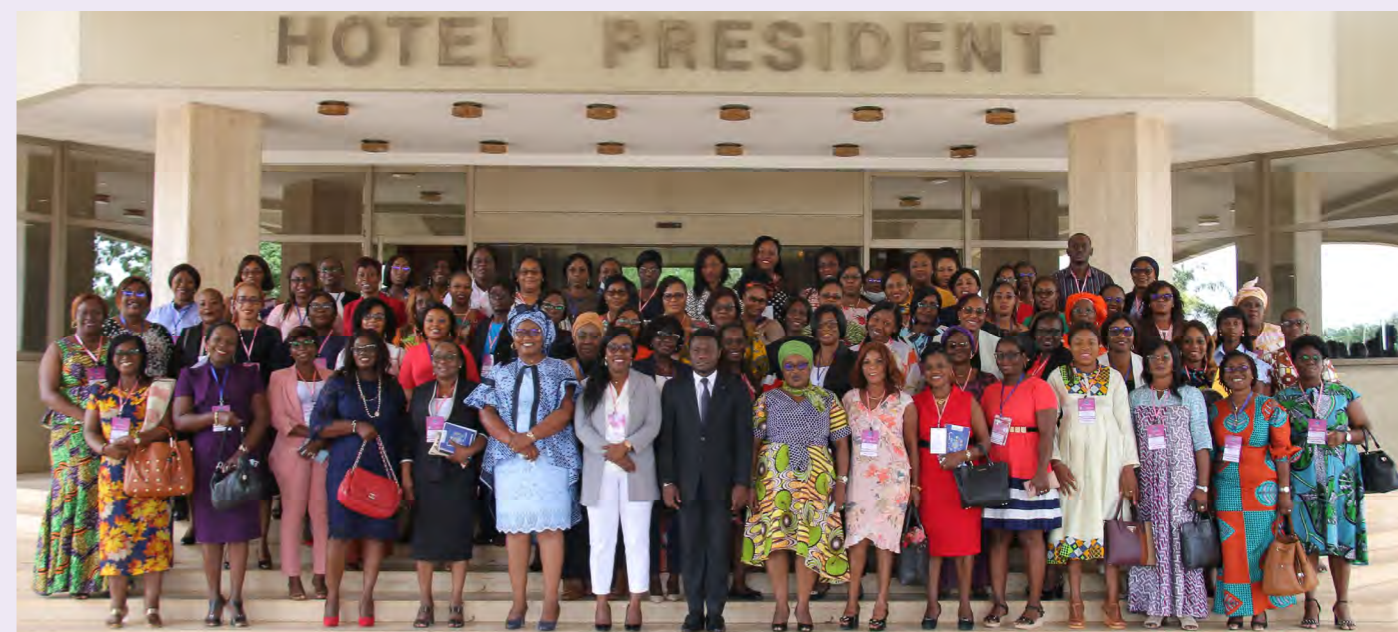
PHOTO DE FAMILLE JNSA 2021